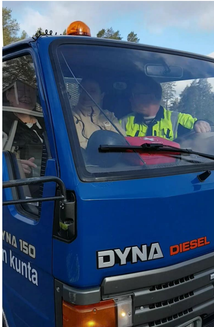
Teknisellä toimella käytössä oleva vuosimallin 1991 Toyota Dyna edustaa hyvin kunnallisen investointitoiminnan pitkäjänteisyyttä.